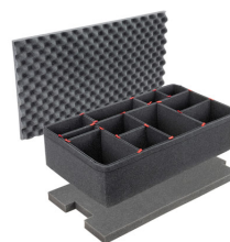
1615TPKIT TrekPak Koffer Teiler Kit