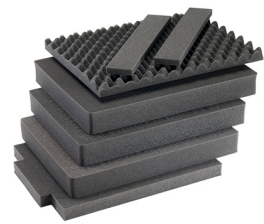
1607AirFS 3 St. Ersatz-Schaumstoffeinsätze