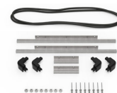
iM2306-M4-BEZEL-L Deckel-Lünette (metrisch)