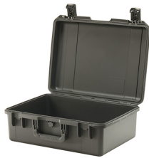
iM2600-X0000 No Foam