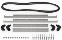
iM2600-M4-BEZEL-L Deckel-Lünette (metrisch)