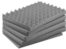
iM2600-FOAM 5 St. Ersatz-Schaumstoffeinsätze