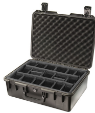
iM2600-X0002 With Padded Dividers