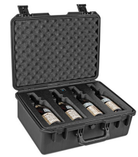
WHISKY-MULTIB Quad Whiskey