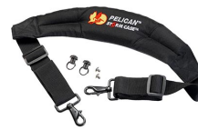
iM-STRAP-S-VER2 Padded Shoulder Strap