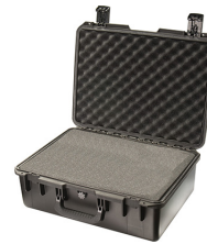
iM2600-X0001 With Foam