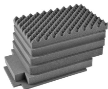
iM2620-FOAM 6 St. Ersatz-Schaumstoffeinsätze