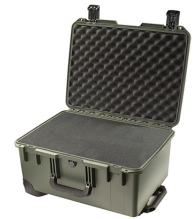
iM2620-X0001 With Foam