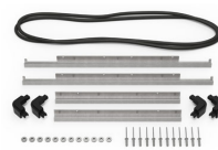
iM2620-M4-BEZEL-L Deckel-Lünette (metrisch)