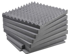
iM2875-FOAM 7 St. Ersatz- Schaumstoffeinsätze