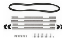
iM2875-M4-BEZEL-L Deckel-Lünette (metrisch)