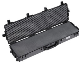
1755WF With Foam