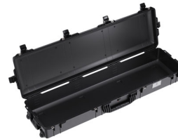
1755NF No Foam