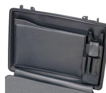
1498 Computer Lid Organizer