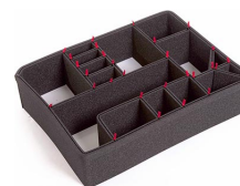
1600EUTP TrekPak Koffer Teiler Kit