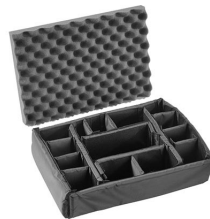
iM2300-DIV Cloison en mousse