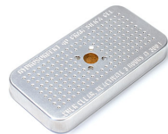
1500D Gel de silice dessicant