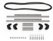
iM2306-M4-BEZEL-L Lunette du couvercle (métrique)