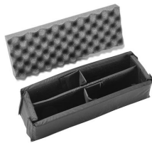
iM2306-DIV Cloison en mousse