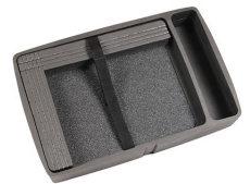
iM2370-COMPTRAY Plateau d'ordinateur