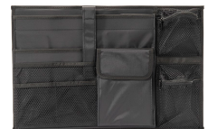
iM26XX-UTILITYORG Pochette utilitaire