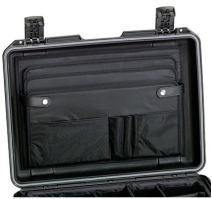
iM26XX-LIDORG Pochette couvercle