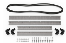
iM2620-M4-BEZEL Lunette de base (métrique)