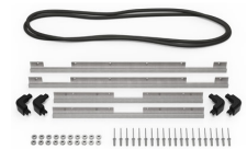
iM2750-M4-BEZEL-L Lunette du couvercle (métrique)