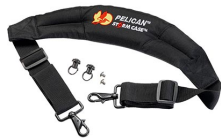
iM-STRAP-S-VER2 Bandoulière rembourrée