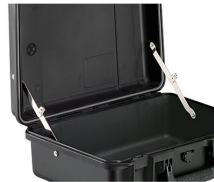
iM-LIDSTAY Compas de couvercle