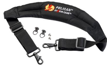
iM-STRAP-S-VER2 Bandoulière rembourrée