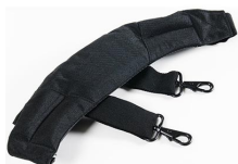
1432 Jeu de sangles