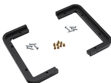
1430PF Cadre de panneau pour application spéciale