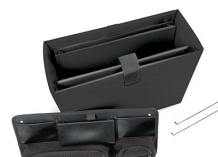
1436 Trousse de séparateurs bureau