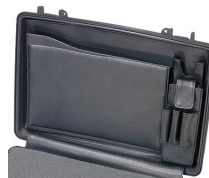
1498 Classeur à compartiments pour couvercle d'ordinateur