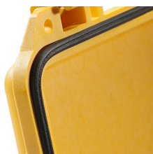
1703 Joint torique de remplacement