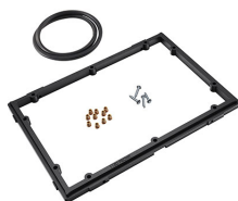
1150PF Cadre de panneau pour application spéciale