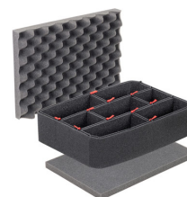
1450TPKIT Kit de séparation de la valise TrekPak