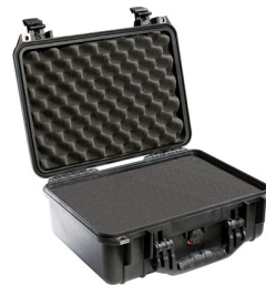
1450WF With Foam