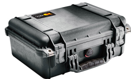
1450NF No Foam