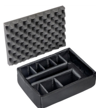
1455 Cloison en mousse