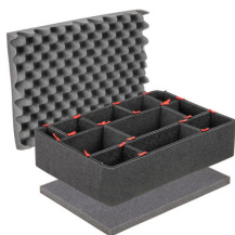
1520TPKIT Kit de séparation de la valise TrekPak