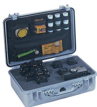
1508 Pochette couvercle photographe