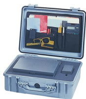
1509 Pochette couvercle