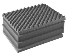
1601 Jeu de mousses de rechange, 4 pièces