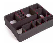
1600EUTP Kit de séparation de la valise TrekPak