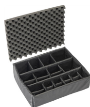
1605 Cloison en mousse