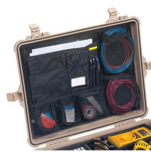
1609 Pochette couvercle