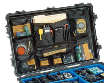
1659 Photo/Pochette couvercle