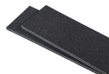
1525TPDIV Séparateurs TrekPak supplémentaires