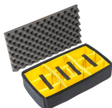
1525AirDS Cloison en mousse