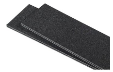
1525TPDIV Séparateurs TrekPak supplémentaires