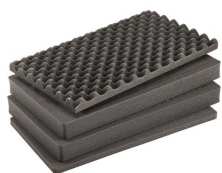
1555AirFS Jeu de mousses de rechange, 4 pièces