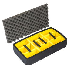
1555AirDS Cloison en mousse