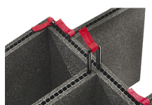
1555TP-KIT Kit de séparation de la valise TrekPak