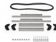
iM2200-M4-BEZEL-L Deckel-Lünette (metrisch)