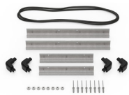
iM2200-MBEZ-B Bodenlünnette (metrisch)