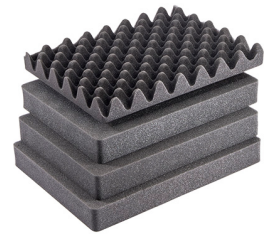
1507AirFS 5 St. Ersatz-Schaumstoffeinsätze