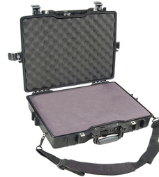
1495WF With Foam