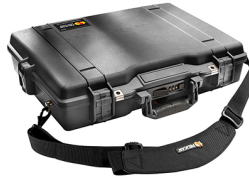
1495NF No Foam