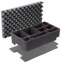
1510TPKIT TrekPak Koffer Teiler Kit