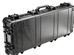
1700NF No Foam