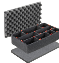
1485TPKIT TrekPak Koffer Teiler Kit