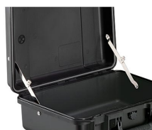
iM-LIDSTAY Compas de couvercle