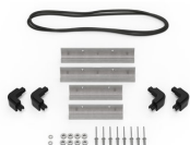
iM20XX-M4-BEZEL Lunette de base (métrique)