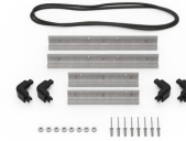
iM2100-MBEZ-B Lunette de base (métrique)