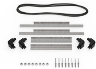
iM2200-M4-BEZEL-L Lunette du couvercle (métrique)