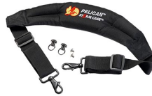
iM-STRAP-S-VER2 Bandoulière rembourrée