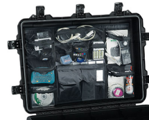
iM3075-UTILITYORG Pochette utilitaire