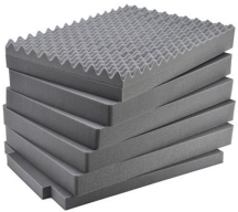
iM3075-FOAM Jeu de mousses de rechange, 7 pièces