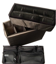
1445 Cloisons en mousse et Pochette couvercle Utility