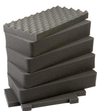
1441 Jeu de mousses de rechange, 6 pièces