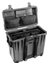
1447 With Padded Office Divider Set & Lid Organizer