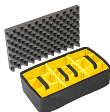
1515 Cloison en mousse