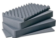
1511 Jeu de mousses de rechange, 4 pièces