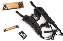
RucPac-normal Conversion sac à dos RucPac standard Hardcase