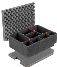
1560TPKIT Kit de séparation de la valise TrekPak