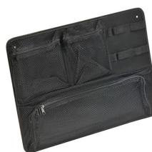
1569 Pochette couvercle