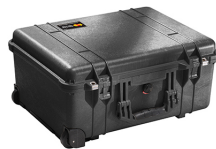
1560NF No Foam