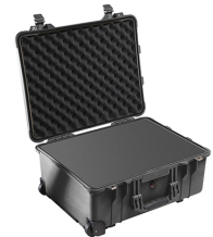
1560WF With Foam