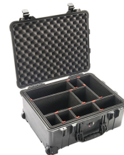
1560TP With TrekPak Divider System