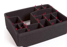
1560EUTP Kit de séparation de la valise TrekPak