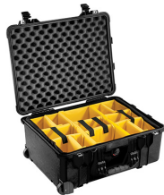
1564 With Padded Dividers