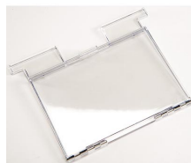
1630DC Accessoire conteneur de documents