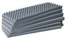
1741 Jeu de mousses de rechange, 6 pièces