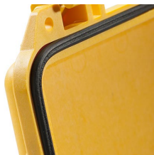
1743 Joint torique de remplacement