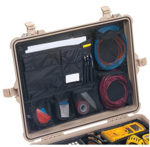
1609 Pochette couvercle