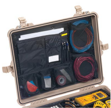
1609 Pochette couvercle