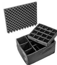
1625 Cloison en mousse