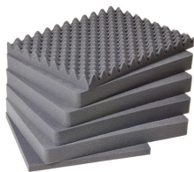
1621 Jeu de mousses de rechange, 6 pièces