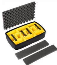
1535AirDS Cloison en mousse