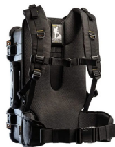
RucPac-Pro-1 Conversion sac à dos RucPac Pro Hardcase