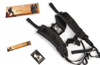
RucPac-normal Conversion sac à dos RucPac standard Hardcase