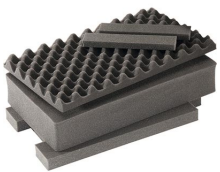
1535AirFS Jeu de mousses de rechange, 3 pièces