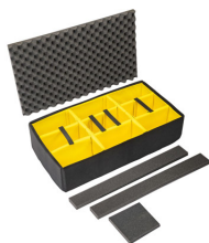
1615AirDS Set di divisori imbottiti