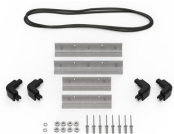
iM20XX-M4-BEZEL Lunetta della base (metrica)