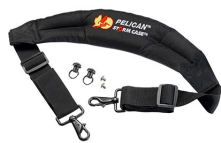
iM-STRAP-S-VER2 Padded Shoulder Strap