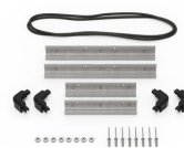
iM2100-MBEZ-B Lunetta della base (metrica)