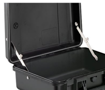
iM-LIDSTAY Supporto per coperchio