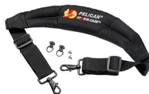
iM-STRAP-S-VER2 Padded Shoulder Strap