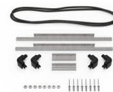
iM2306-M4-BEZEL-L Coperchio (metrico)