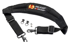
iM-STRAP-S-VER2 Padded Shoulder Strap