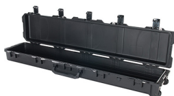
iM3410-X0000 No Foam