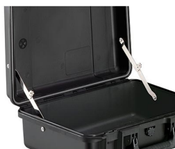
iM-LIDSTAY Supporto per coperchio