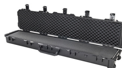
iM3410-X0001 With Foam