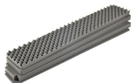
iM3410-FOAM 4 pz. set ricambio schiuma