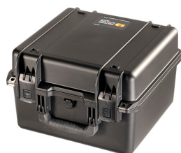
iM2275-X0000 No Foam