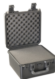
iM2275-X0001 With Foam