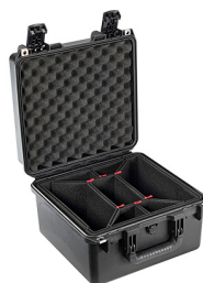
iM2275-X0006 With TrekPak Divider System