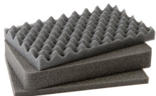
1171 3 pz. set ricambio schiuma